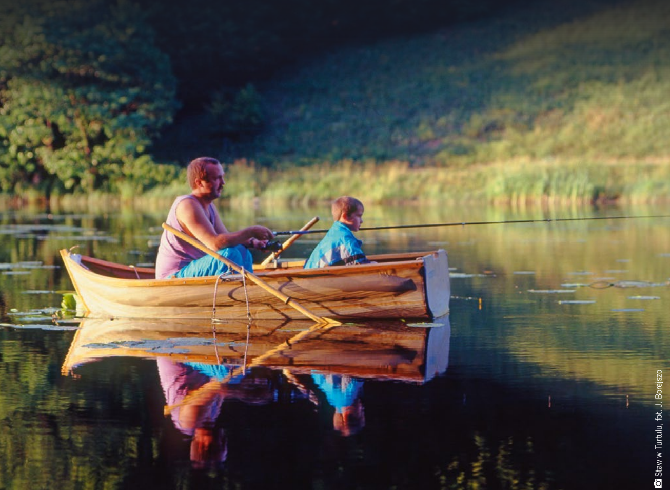
Staw w Turtulu, fot. J. Borejszo

Łowiska położone nad licznymi jeziorami i rzekami województwa podlaskiego stanowią znaczący atut dla odwiedzających region wędkarzy. Wielu amatorów wędkowania przyciąga zwłaszcza imponujący wielkością zbiornik wodny Siemianówka. Doskonałe połowy udają się również w północnej części województwa, w jeziorach augustowskich lub ośrodkach przygotowanych specjalnie dla „wypoczywających z wędką”, np. nad jeziorem Boksze. W regionie jest także wiele miejsc, w których można skosztować smacznych potraw z tutejszych ryb słodkowodnych.