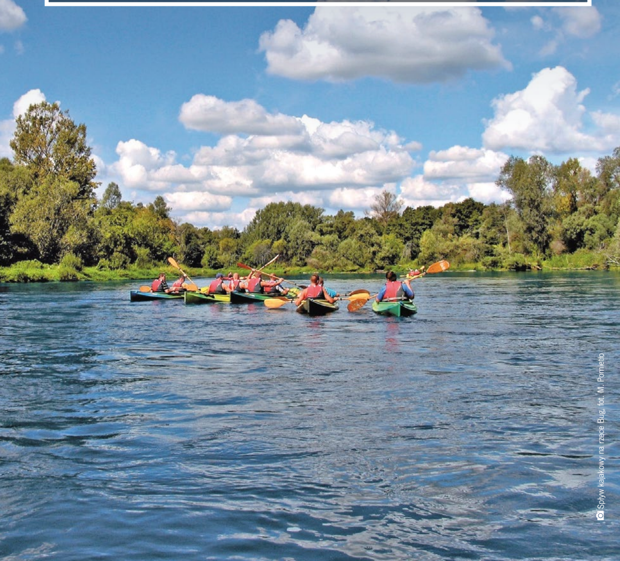
Spływ kajakowy na rzece Bug

Bogactwo przyrodnicze podlaskich rzek najlepiej poznawać z bliskiej perspektywy, np. z kajaka. Nad Biebrzą możecie również wybrać się na spływ tratwą rzeczną, a nad Narwią zaskoczą Was tradycyjne łodzie, zwane pychówkami. Wizytówką Biebrzy są rozległe bagna i torfowiska, liczne gatunki gniazdujących tu ptaków, a także król tych terenów – łoś. Wijąca się meandrami Narew, z silnie rozgałęzionym korytem i otaczającymi je terenami bagiennymi, jest nazywana „polską Amazonką”. Bug natomiast poniesie Was w malownicze i ciekawe kulturowo południe regionu.