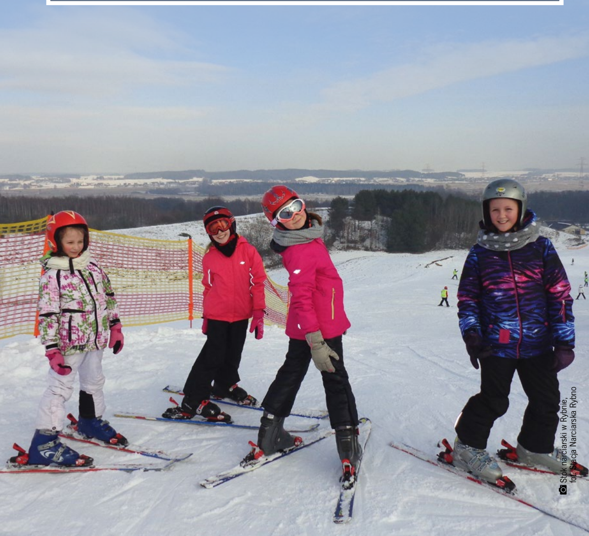
Stok narciarski w Rybnie, to Stacja Narciarska Rybno

WOSiR Szelmant i Stacja Narciarska Rybno dysponują różnorodnymi trasami zjazdowymi oraz wypożyczalniami i serwisem sprzętu, a stawiający