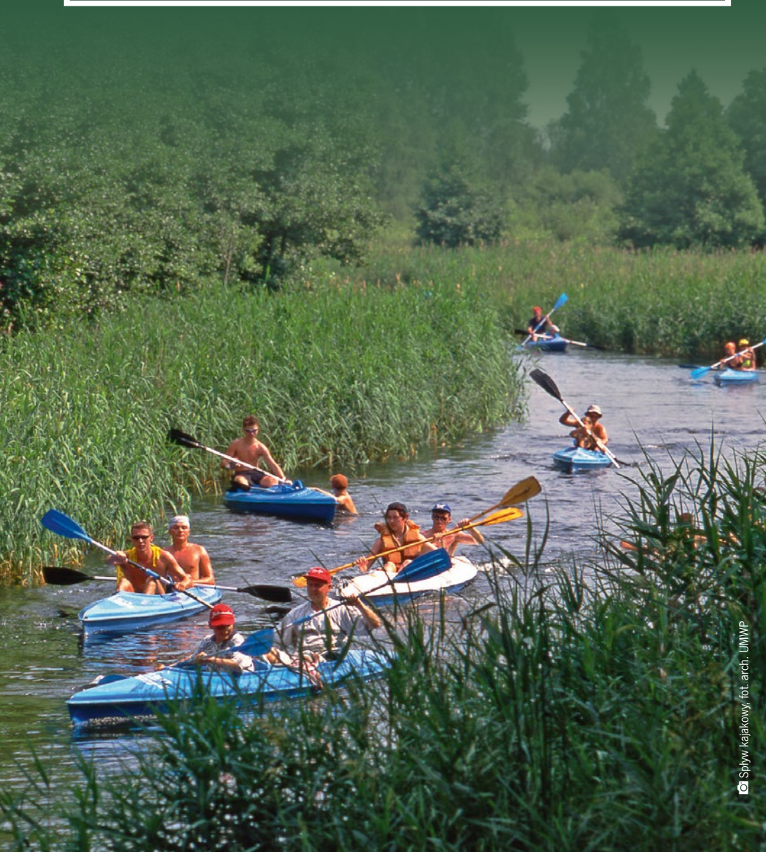
Spływ kajakowy

Liczne jeziora i malownicze rzeki sprzyjają turystom preferującym wypoczynek na wodzie. Spływy kajakowe Sokołdą czy Biebrzą pozwalają cieszyć się bliskością przyrody oraz podziwiać drewnianą architekturę podlaskich wsi. Z kolei nowoczesne wyciągi nart wodnych w Augustowie, Szelmencie czy Wasilkowie zachęcają do uprawiania sportów wodnych.