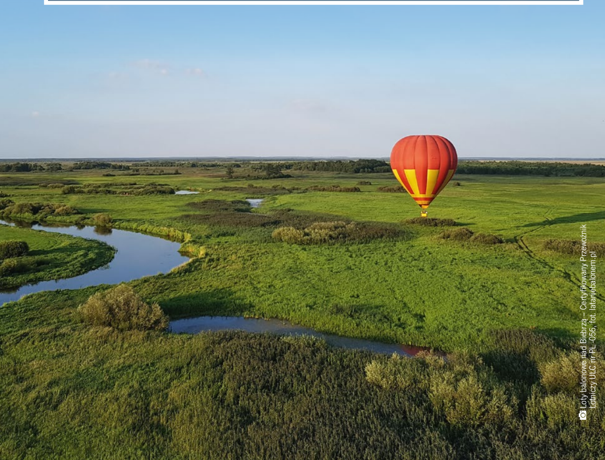
Loty balonowe nad Biebrzą – Certyfikowany Przewoźnik Lotniczy ULG nr PL-056

Entuzjaści ekstremalnych doznań nie zawiodą się także w WOSiR Szelment koło Suwałk. Trzy trasy parku linowego z różnym stopniem trudności i osmiometrowa ścianka wspinaczkowa o powierzchni 80 m 2 pozwalają dać upust energii i cieszyć się pokonywaniem własnych ograniczeń. Ośrodek dysponuje również polem do gry w paintball.