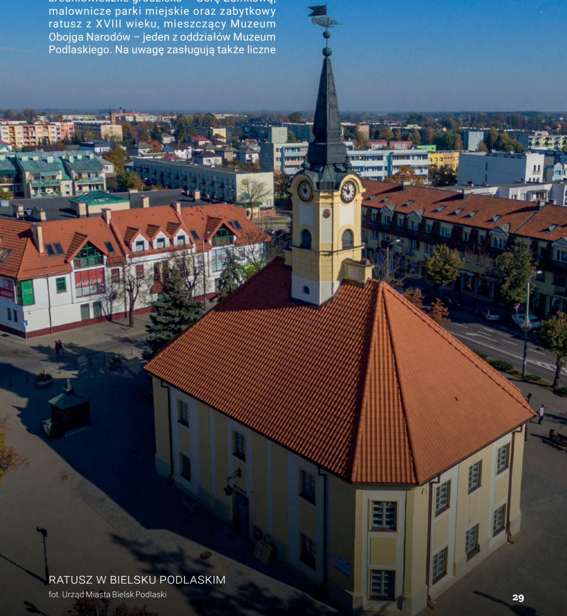
RATUSZ W BIELSKU PODLASKIM

Miasto słynie również z bogatego życia kulturalnego. Organizowane tu festiwale muzyki, folkloru i poezji przyciągają gości z całej Polski i zagranicy.