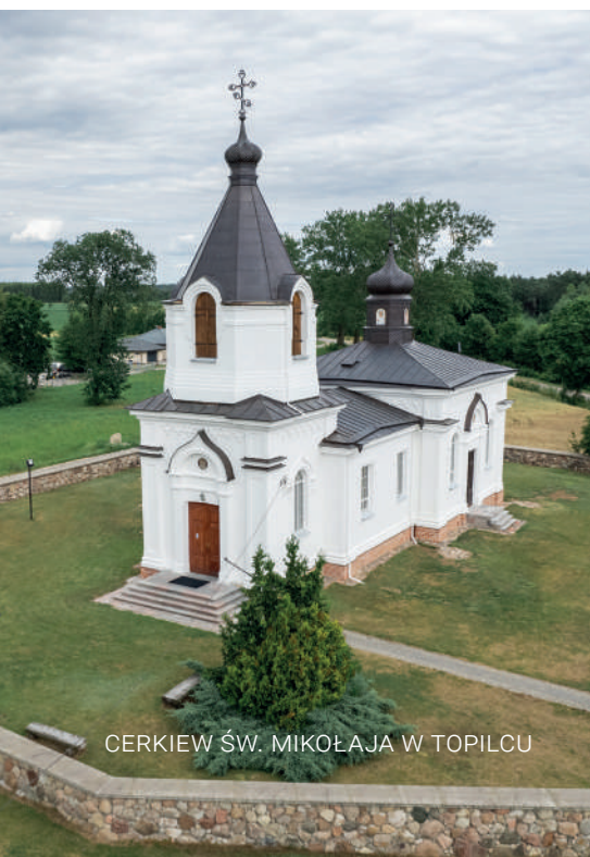
CERKIEW ŚW. MIKOŁAJA W TOPILCU

Gmina Turośń Kościelna położona jest w malowniczej otulinie Narwiańskiego Parku Narodowego. Jej największym bogactwem są rozlewiska Narwi oraz ujścia dopływów, takich jak Turośnianka czy Niewodnica. Te naturalne tereny bagienne i nadrzeczne stanowią oazę dla licznych gatunków ptaków – można tu spotkać czaple, żurawie, a także bobry czy łosie. Miłośnicy aktywnego wypoczynku znajdą tu dobrze oznakowane szlaki piesze, rowerowe i konne prowadzące przez lasy, łąki i wsie z zachowanymi elementami zabudowy tradycyjnej.