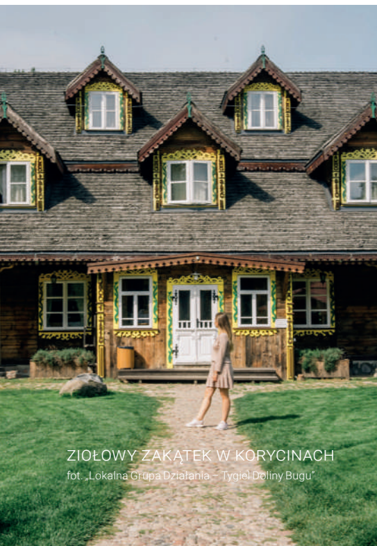
ZIOŁOWY ZAKĄTEK W KORYCINACH

Przebywając tam, warto wybrać się do Mielnika, gdzie znajduje się słynna Góra Zamkowa z ruinami kaplicy św. Aleksandra, a także zabytkowe cerkwie i kościoły oraz synagoga z I połowy XIX w. Ciekawostką na mapie regionu jest również Odkrywkowa Kopalnia Kredy w Mielniku, która jest jedyną czynną tego typu kopalnią w kraju. Zmotoryzowani na pewno zechcą udać się w kierunku Świętej Góry Grabarki – najważniejszego sanktuarium prawosławnego w Polsce, a także odwiedzić pobliskie Tokary i Niemirowo, gdzie znajdują się zabytkowe obiekty sakralne. Można też wyruszyć do Drohiczyzna i zawitać do Muzeum Kajakarstwa lub też udać się do Ciechanowca, gdzie mieści się słynne Muzeum Rolnictwa. Miłośnikom natury i zainteresowanym medycyną naturalną z pewnością przypadnie do gustu Ziołowy Zakątek w Korycinach – malownicze miejsce, w którym można poznać bogactwo roślin leczniczych, zobaczyć zabytkowe obiekty podlaskiej architektury drewnianej i spróbować regionalnych specjalistów. Warto wybrać się również na szlak Wielkiego Gościńca Litewskiego, który był niegdyś najważniejszym szlakiem handlowym i pocztowym Rzeczypospolitej Obojga Narodów w XVII i XVIII w.