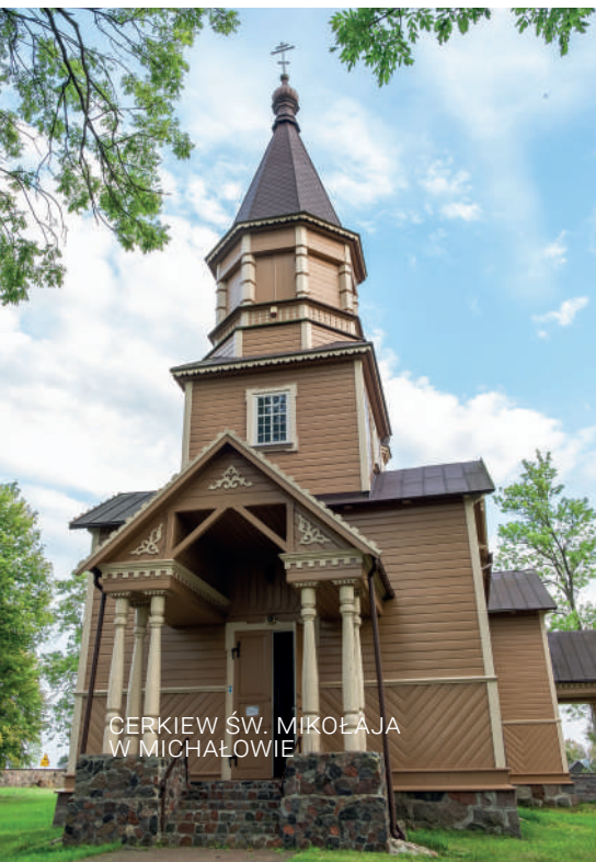
CERKIEW ŚW. MIKOŁAJA W MICHAŁOWIE

Gmina Michałowie położona jest 36 km na południowy wschód od Białegostoku. To na jej terenie znajduje się rezerwat Gorbacz, który chroni jedno z ostatnich w tej części Polski jezioro z okresu zlodowacenia środkowopolskiego. Bliskość Puszczy Knyszyńskiej sprawia, że nawet najbardziej wymagający znajdą tam coś dla siebie – miłośnicy natury zobaczą unikalną szatę roślinną, rowerzyści i spacerowicze będą mogli skorzystać z wyjątkowych szlaków turystycznych, zaś zwolennicy sportów wodnych i wędkowania miło spędzą czas nad rzekami Supraśl i Narew oraz zalewem Siemianówka.