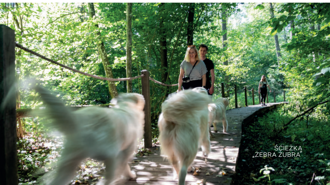
ŚCIEŻKA „ŻEBRA ŻUBRA”