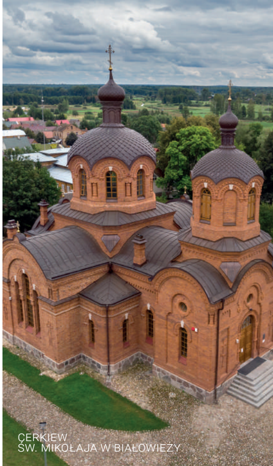
CERKIEW ŚW. MIKOŁAJA W BIAŁOWIEŻY

Będąc tu, warto jest udać się do Parku Pałacowego, który otaczał nieistniejący już pałac cara Aleksandra III, a także zwiedzić Muzeum Przyrodniczo-Leśne Białowieżyńskiego Parku Narodowego, będące najstarszym muzeum w polskich parkach narodowych. Nie można zapomnieć o cerkwi pw. św. Mikołaja Cudotwórcy, gdzie znajduje się unikatowy ceramiczny ikonostas. Zwolennicy aktywnego wypoczynku powinni wyposażyć się w odpowiednie obuwie i kije, by wyruszyć w trasę po jednym z wielu szlaków Nordic Walking, zaplanować spacer po słynnej ścieżce edukacyjnej „Żebra Żubra” albo wybrać się na niezapomnianą wycieczkę rowerową po starej puszczy. Sportowe podboje warto poprzedzić wizytą w Centrum Turystyki i Promocji „Kraina Żubra” w Budach Leśnych, gdzie zdobyć można informacje dotyczące najpiękniejszych i najciekawszych tras.