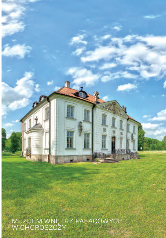
MUZEM WNĘTRZ PAŁACOWYCH W CHOROSZCZY

Odwiedzając te tereny, warto jest wstąpić na kładkę Waniewo-Śliwno, z bliska obejrzeć Zerwany Most w Kruszewie, zajrzeć do XVII-wiecznego bastionu obronnego „Koziołek”, a także zawitać do samej Choroszczy, gdzie znajdują się przepiękne zabytki architektury sakralnej i umiejscowiona na sztucznej wyspie wśród zieleni Letnia Rezydencja Branickich, gdzie obecnie mieści się Muzeum Wnętrz Pałacowych. Latem nie można przegapić słynnego Jarmarku Dominikańskiego w Choroszczy.