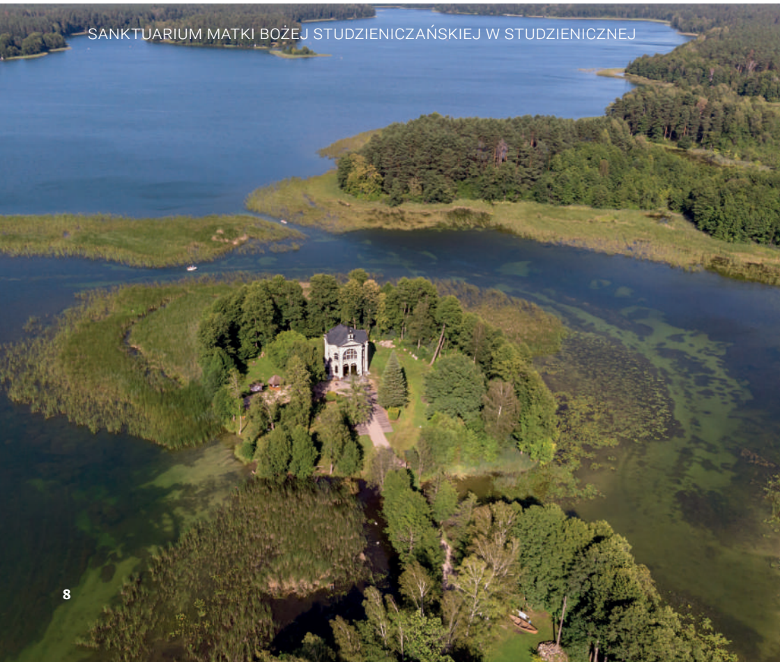
SANKTUARIUM MATKI BOŻEJ STUDZIENICZAŃSKIEJ W STUDZIENICZNEJ

Zwiedzając te tereny, koniecznie należy odwiedzić Augustów - miasto o statusie uzdrowska, którego położenie daje niezliczone możliwości korzystania z wodnych aktywności: miejska plaża z mołem Radiowej Trójki, wypożyczalnie rowerów wodnych i kajaków, rejsy katamaranem, gondolą lub dużym statkiem pasażerskim Żeglugi Augustowskiej. Jest także miejscem, gdzie – na jeziorze Necko – co roku odbywają się słynne Mistrzostwa Polski w Pływaniu na Byle Czym pod hasłem „Co Ma Pływać Nie Utonie”.