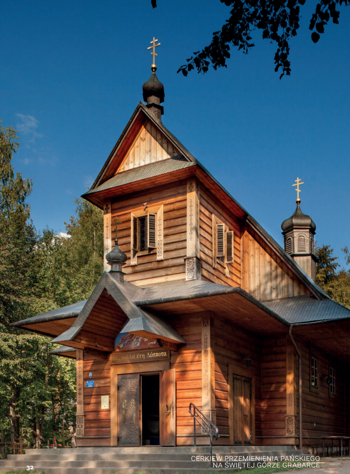
CERKIEW PRZEMIENIENIA PAŃSKIEGO NA ŚWIĘTEJ GÓRZE GRABARCE