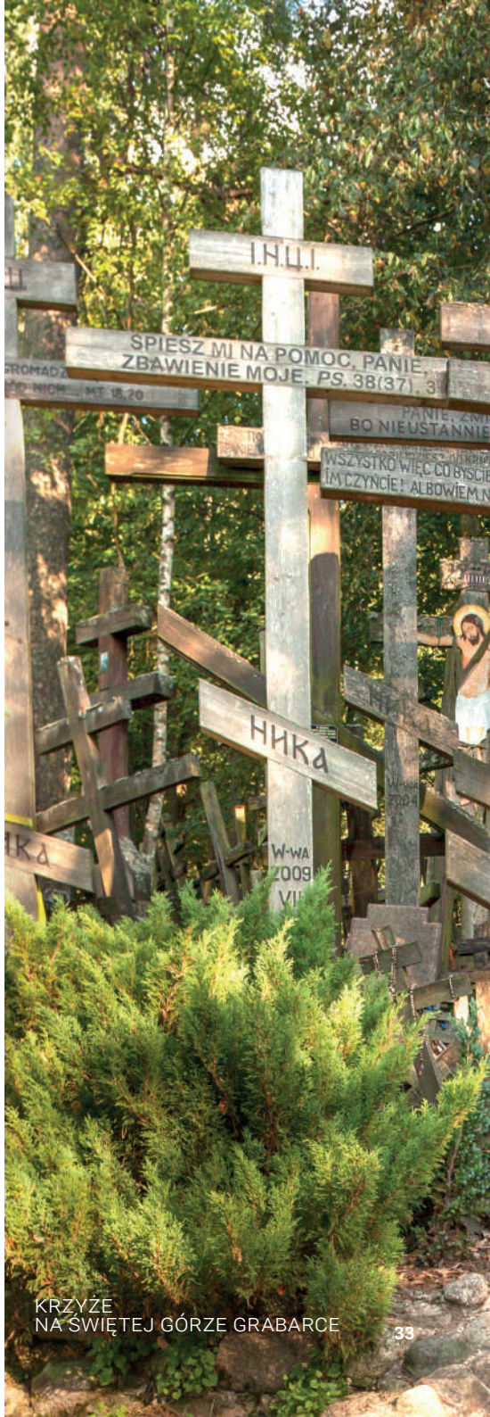
KRZYŻE NA ŚWIĘTEJ GÓRZE GRABARCE