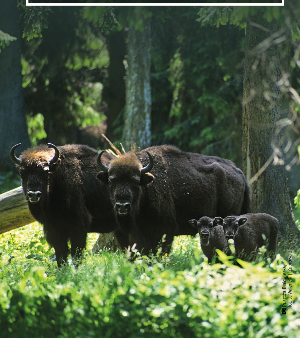
Żubrów 10

Dlaczego Puszcza Białowieska jest unikatowa? Czy można ją zwiedzać bez przewodnika? Które miejsca warto zobaczyć? Turystyka w Białowieskim Parku Narodowym to nie tylko Rezerwat Pokazowy Żubrów, ale także szlaki wiodące bagiennymi borami i malowniczą doliną rzeki Narewka. Warto również odnaleźć ukryte w lesie tzw. „miejsce mocy”, czyli obszar o wyjątkowym promieniowaniu elektromagnetycznym.