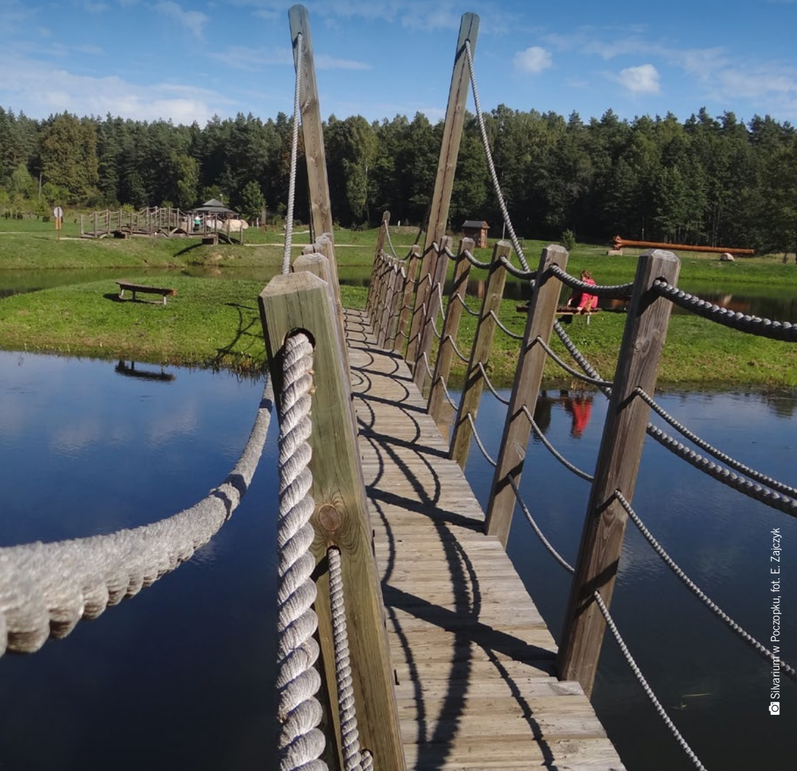
Silvarium w Poczopku

Leśny ogród, arboretum, drewniane krzyże, mogiły powstańcze, wieże widokowe, kładki przyrodnicze i malownicze doliny rzeczne – wszystko to skrywa tajemnicza Puszcza Knyszyńska. W sąsiedztwie żeremi bobrowych spotkacie tu trzmielojada, a w pobliżu torfowisk i łąk gniazdują cietrzewie. Przez tereny Puszczy Knyszyńskiej prowadzi rozbudowana sieć szlaków turystycznych, prezentujących przyrodnicze i historyczne walory tego obszaru.