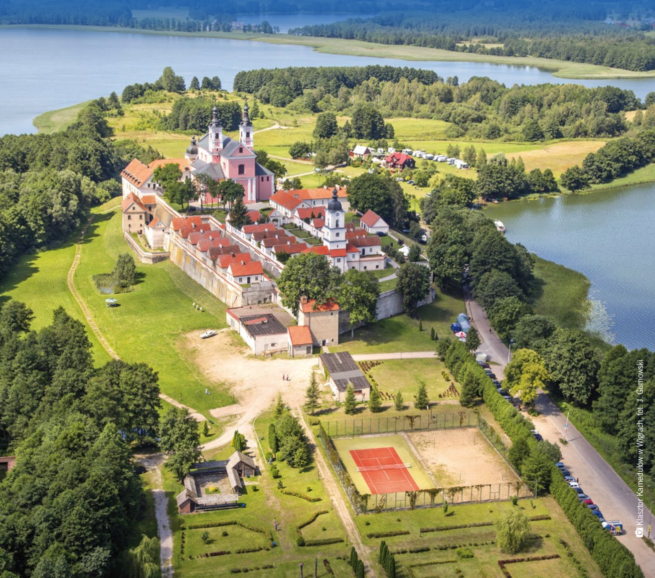
© Kłaztor. Kamedułów w Wigrach, fot. J. Gumowski

Malowniczo wyglądające, skryte w puszczy jeziora, rozległe panoramy rozciągające się z nawet dwustumetrowych wzniesień, łagodne pagórki sejneńskie, idealne na rowerowe wyprawy, i interesujące ścieżki przyrodnicze Wigierskiego Parku Narodowego. Zobacz, jak piękna jest Suwalszczyzna.