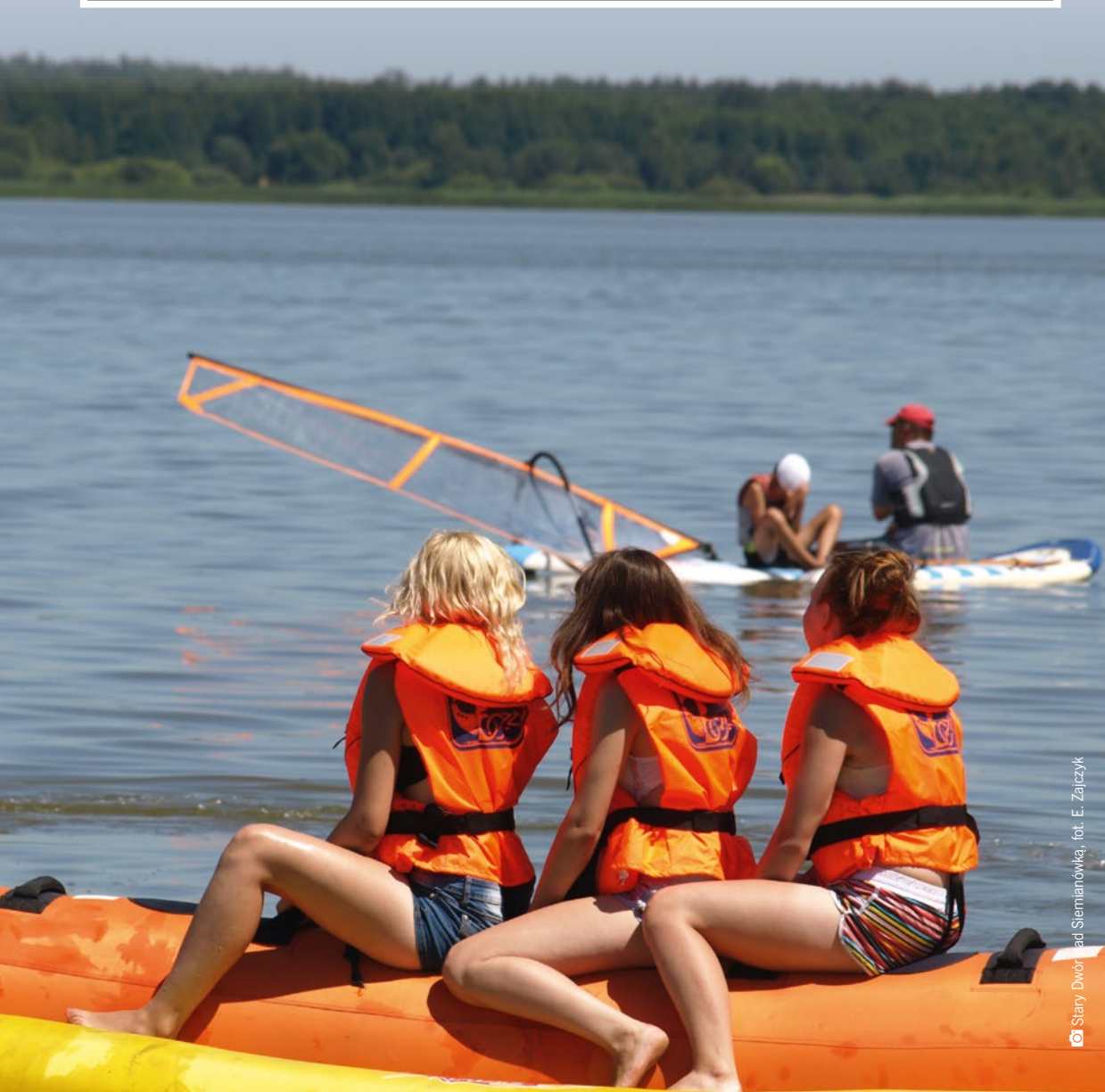
Stary Dwór nad Siemianówką

Na linach i ściankach wspinaczkowych, w basenach, na żaglówkach, nartach lub rowerach – pozytywnie spożytkujcie energię swoich dzieci! W województwie podlaskim niezależnie od pory roku aktywnie spędzicie rodzinny urlop, m.in. w ośrodkach sportów wodnych i parkach linowych.