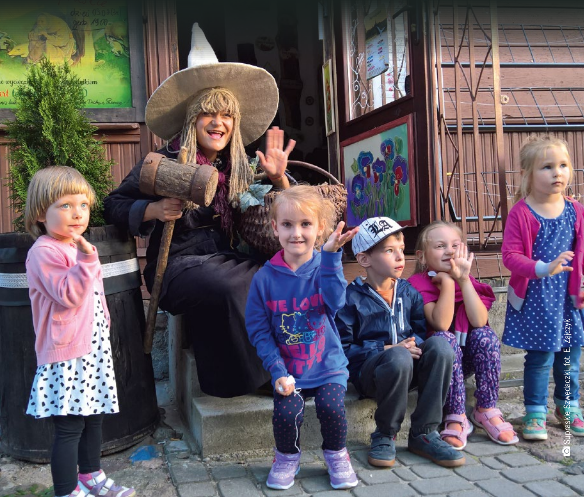
© Supraskie Szwedacki, fot. E. Zajczyk

Krasnoludki, rusalki, duchy, rycerze, królowie, Indianie, a nawet Święty Mikołaj – spotkajcie się z nimi w województwie podlaskim! Podążając Baśniowym Szlakiem Suwalszczyzny, odwiedzając okolice Białegostoku, Suchowoli czy Hajnówki, będziecie mieli okazję przenieść się wraz z całą rodziną w bajkowy świat.