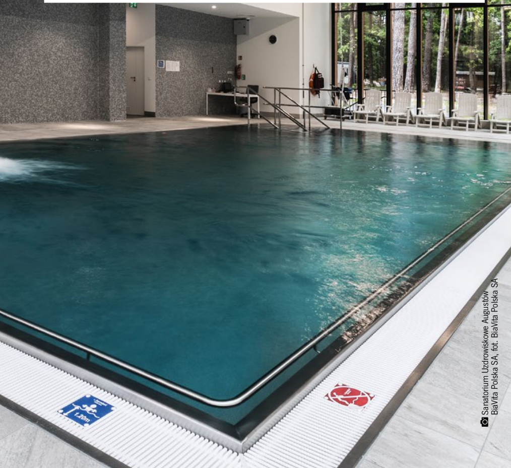
Sanatorium Uzdrowiskowe Augustów BiaVita Polska SA

w Puszczy Knyszyńskiej i usytuowanym w jej sercu uzdrowisku Supraśl , jednym z dwóch na Podlasiu. Tu, na skraju lasu, położone są sanatorium i hotel Knieja ,