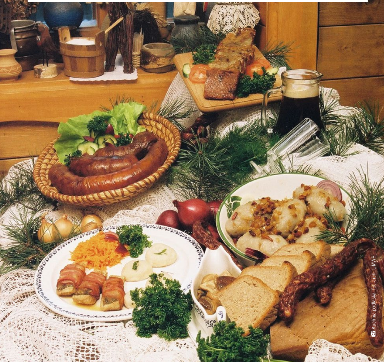
Kuchnia podlaska

Kumpiak, pieriekaczownik, zaguby, kartacze i kiszka ziemniaczana, a na deser sękacz lub hajnowski marcinek – to tylko niektóre z podlaskich produktów regionalnych, wyrabianych do dziś tradycyjnymi sposobami. Wpływy litewskie, rosyjskie, tatarskie i białoruskie oraz wielowiekowe receptury przekładają się na unikatowy smak podlaskich potraw. Warto wyruszyć w kulinarną podróż od Suwałk po Drohiczyn i rozsmakować się w tutejszej kuchni.