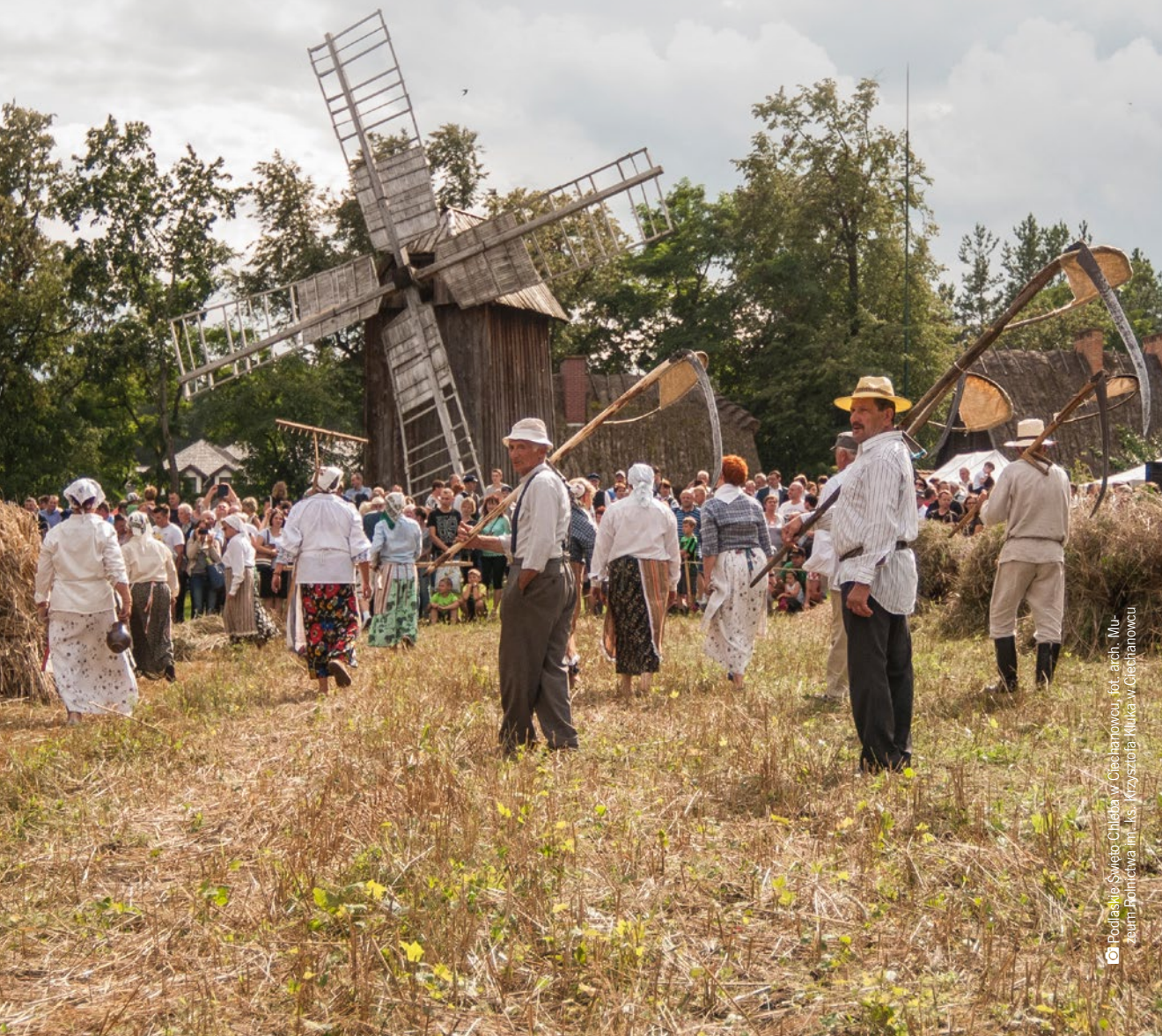
Podlaskie Święto Chleba w Ciechanowcu

Truskawkowa rewia mody, pokazy tradycyjnego wypieku chleba w piecu polowym czy najpiękniejsze utwory muzyki cerkiewnej w absolutnie wyjątkowym otoczeniu – województwo podlaskie oferuje wiele wydarzeń, dzięki którym poznacie charakter, smak i klimat regionu.