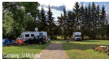
Camping „U Michała”