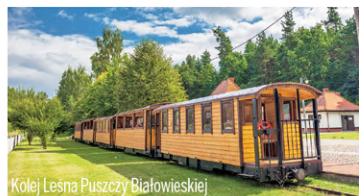
Kolej Lesna Puszczy Białowieskiej