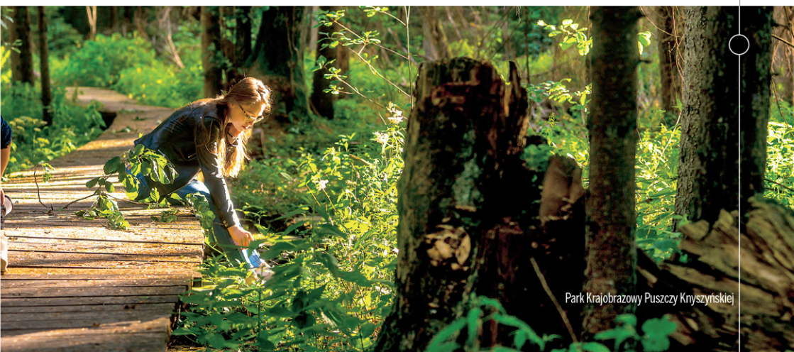
Park Krajobrazowy Puszczy Knyszyńskiej

ul. Piłsudskiego 2 16-100 Sokółka Tel.: +48 85 711 24 86 sokolkait@gmail.com