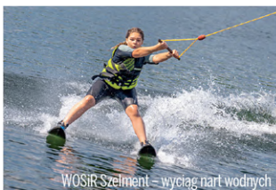
WOSiR Szelmęt – wyciąg nart wodnych