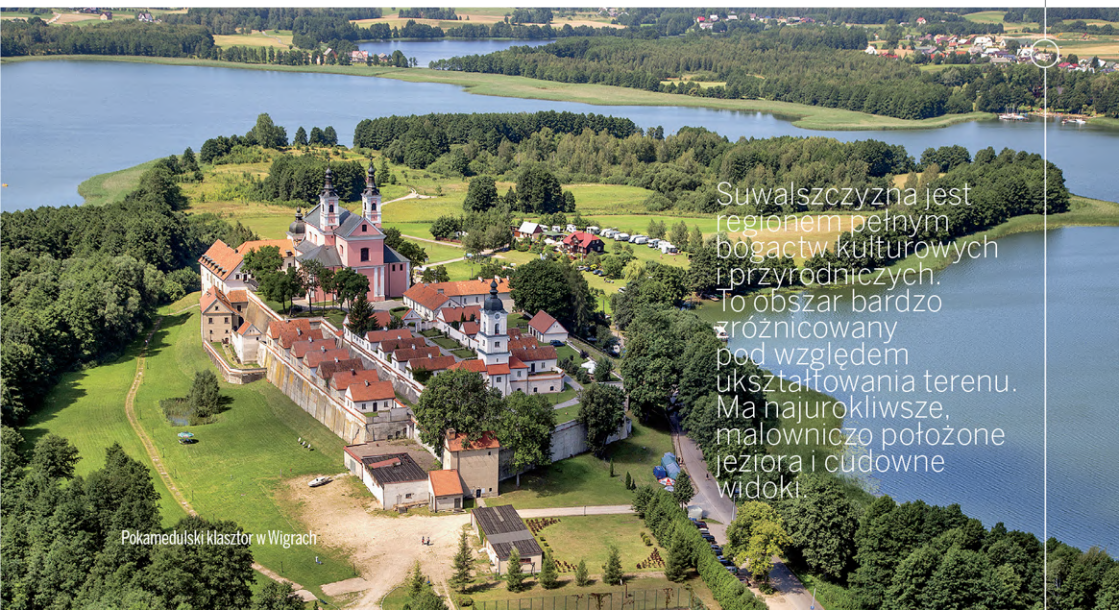
Pokamedulski klasztor w Wigrach

Suwalszczyzna jest regionem pełnym bogactw kulturowych i przyrodniczych. To obszar bardzo różnicowany pod względem ukształtowania terenu. Ma najurokliwsze, malowniczo położone jeziora i cudowne widoki.