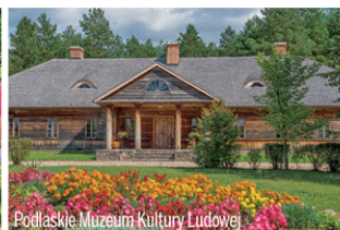
Podlaskie Muzeum Kultury Ludowej