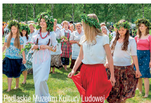
Podlaskie Muzeum Kultury Ludowej

ul. Rynek Kościuszki 10 15-426 Białystok Tel.: +48 85 742 60 31 kawiarnia@esperanto-cafe.pl www.esperanto-cafe.pl