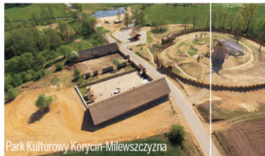
Park Kulturowy Korycin-Milewsczyzna