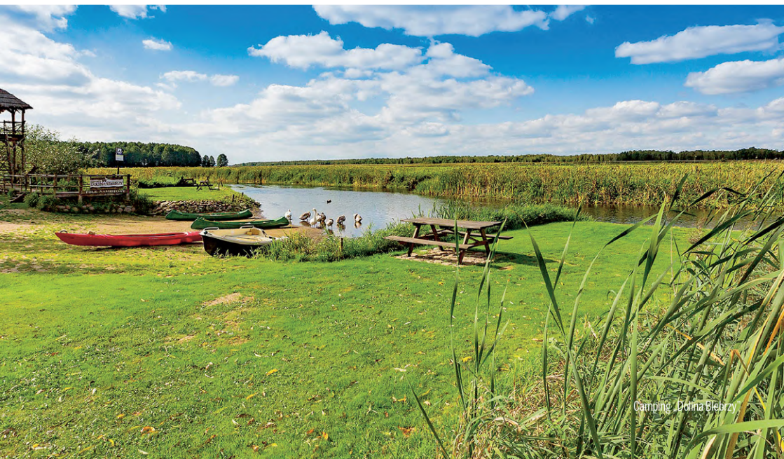
Camping „Dolina Biebrzy”