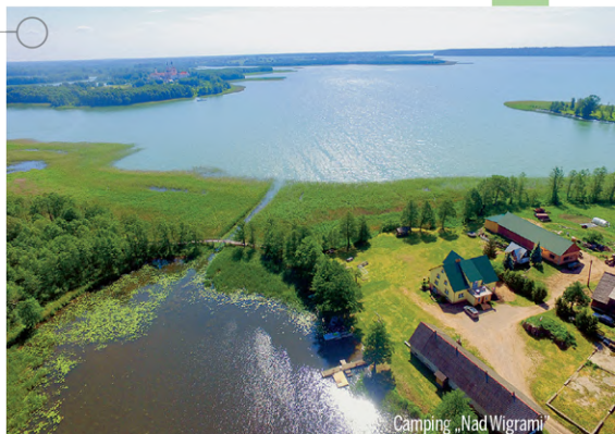
Camping „Nad Wigrami”