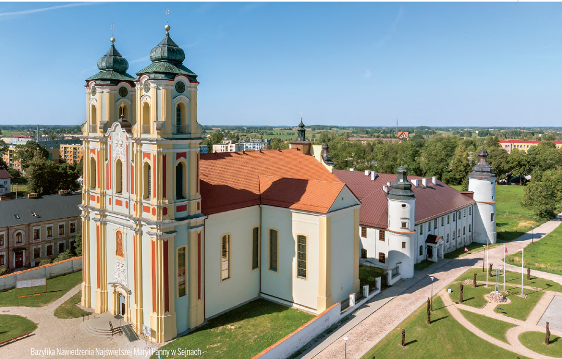
Bazylika Nawiedzenia Najświętszej Maryi Panny w Sejnach

Ziemia sejneńska wtulona jest w najdalszy zakątek północno-wschodniej Polski i otoczona głęboką zielenią Puszczy Augustowskiej i Wigierskiego Parku Narodowego. Połudowcowe pagórki, szumiące stare bory i gaje oraz imponująca ilość tamtejszych jezior i rzek tworzy charakterystyczny krajobraz tego terenu, a rzadkie gatunki zwierząt i roślin znajdują tam swoje bezpieczne schronienie. To miejsce o ciekawej kulturze i historii, na które duży wpływ miała bliskość Litwy i Białorusi. Działający tutaj Ośrodek „Pogranicze – sztuk, kultur, narodów” gwarantuje spotkania z kulturą – przez duże „K” i przez cały rok.