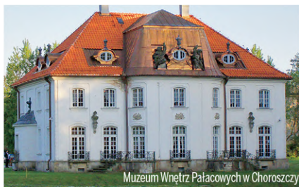
Muzeum Wnętrz Pałacowych w Choroszczy

ul. abp. gen. M. Chodakowskiego 6 16-030 Supraśl Tel.: +48 85 718 37 85 sekretariat@pkpk.pl www.pkpk.wrotapodlasia.pl