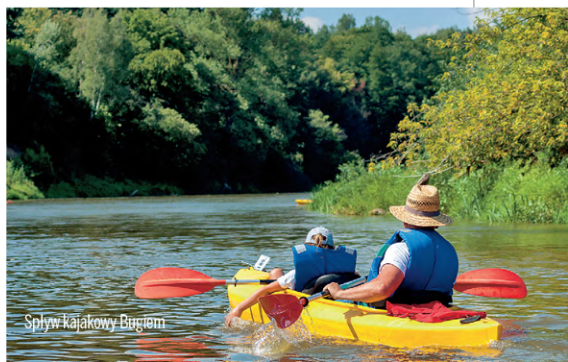
Spływ kajakowy Bugiem